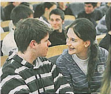
Nur fünf Prozent der HPI-Studenten sind Frauen. Diese übt den „Dreiecksblick“

mer ergattert, sei der erste Schritt getan. Doch die nächste Herausforderung wartet schon: die SMS. Nicht zu fordernd, die Anrede soll persönlich sein, so auch der Gruß. LG sei verboten, laut Senftleben stehe es für LanGweiler.