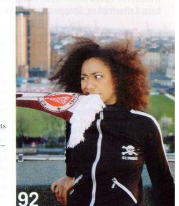
92 AUSGEHEN WIE HAMBURGS PROMIS Wo essen Stars wie Noah Sow, wer bietet den besten VIP-Service?