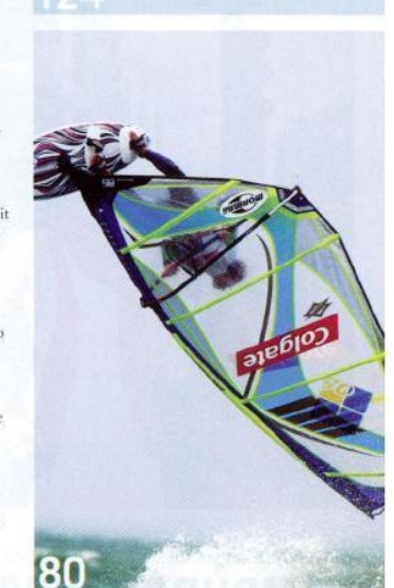
80 WINDSURF WORLD CUP Wenn wieder die Boards vor Westerland fliegen, können sechs Leser dabei sein